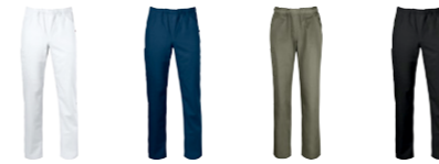
01 white 29 ocean blue 39 army green 99 black