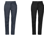
88 blumelange 99 black