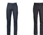
88 blumelange 99 black