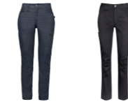
88 blumelange 99 black