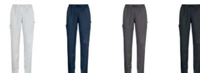
01 white 29 ocean blue 97 graphite 99 black