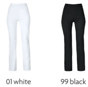
01 white 99 black