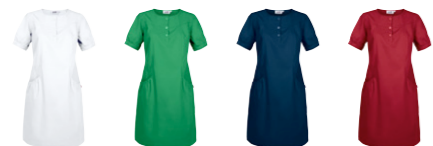
01 white 17 emerald 29 ocean blue 66 dark red