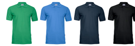
17 emerald 22 light blue 28 navy 99 black