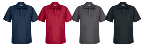
29 ocean blue 66 dark red 97 graphite 99 black