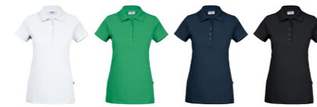
01 white 17 emerald 28 navy 99 black