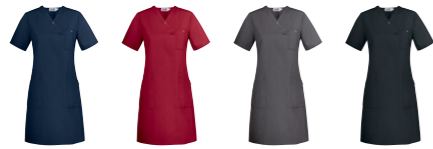
29 ocean blue 66 dark red 97 graphite 99 black