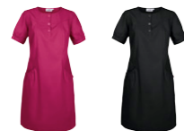
70 fuchsia 99 black