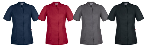
29 ocean blue 66 dark red 97 graphite 99 black