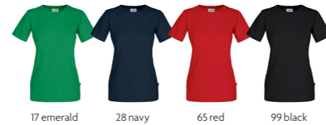
17 emerald 28 navy 65 red 99 black