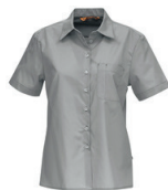
642-930 v. harmaa