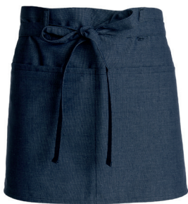
159-768 meleerattu sininen