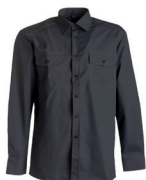
493-980 tumman- harmaa