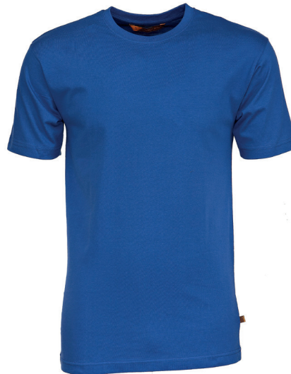
K02-750 kirkas sininen

Lyhythihainen, laadukas T-paita. Koot: XS - 4XL Materiaali: 100% co