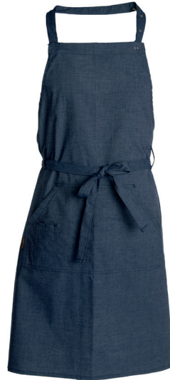
159-768 meleerattu sininen