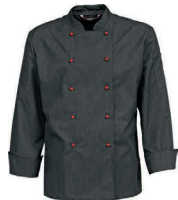
629-958 meleerattu harmaa

Esiliina, jossa kaksi isoa taskua edessä sekä kynätas- ku. Nauhakiinnitys. Pituus 60cm, leveys 88cm. Koot: yksi koko Materiaali: 65% pes, 35% co