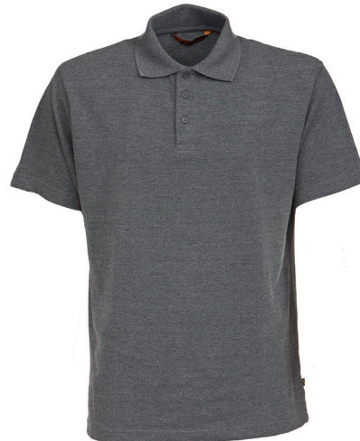
K42-775 meleerattu harmaa