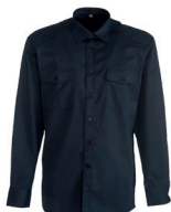
493-790 tumman- sininen

Pitkähihainen twill-paita eturintataskuilla. Unisex malli miehille ja naisille.