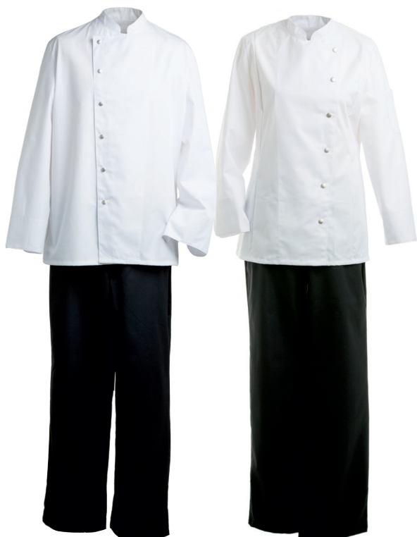
Kokki puoliessu pituus 60 cm